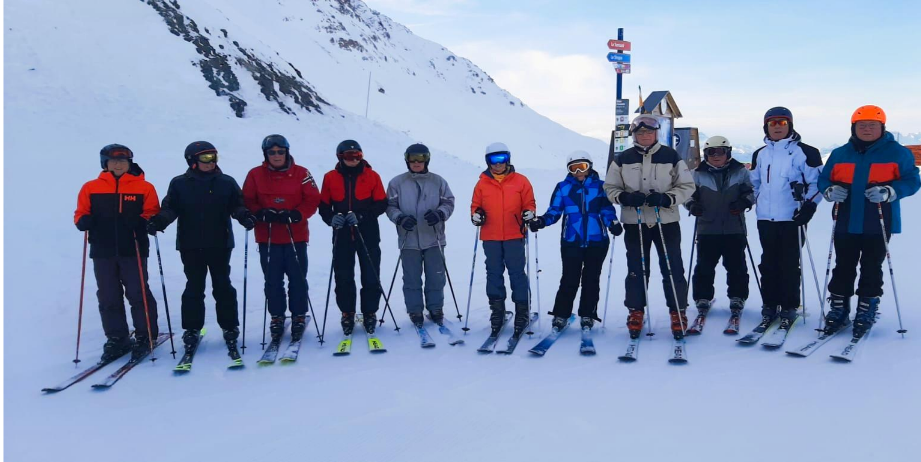
Le groupe des skieurs au sommet