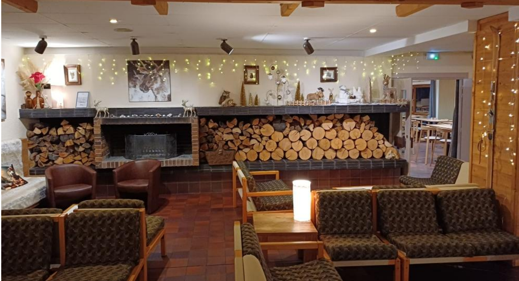
La cheminée du chalet