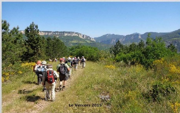
Le Vercors 2015