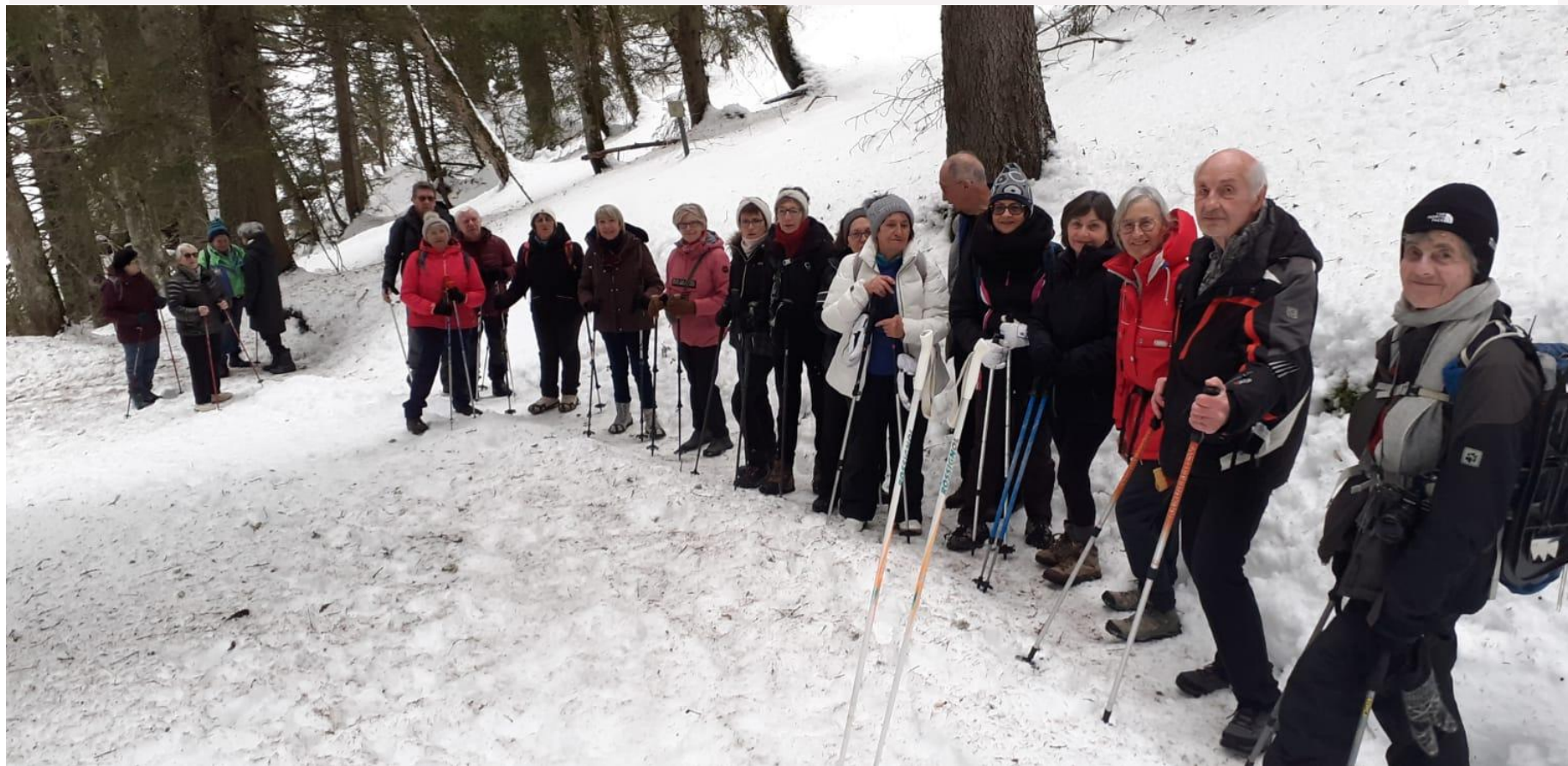
Le groupe des Randonneurs