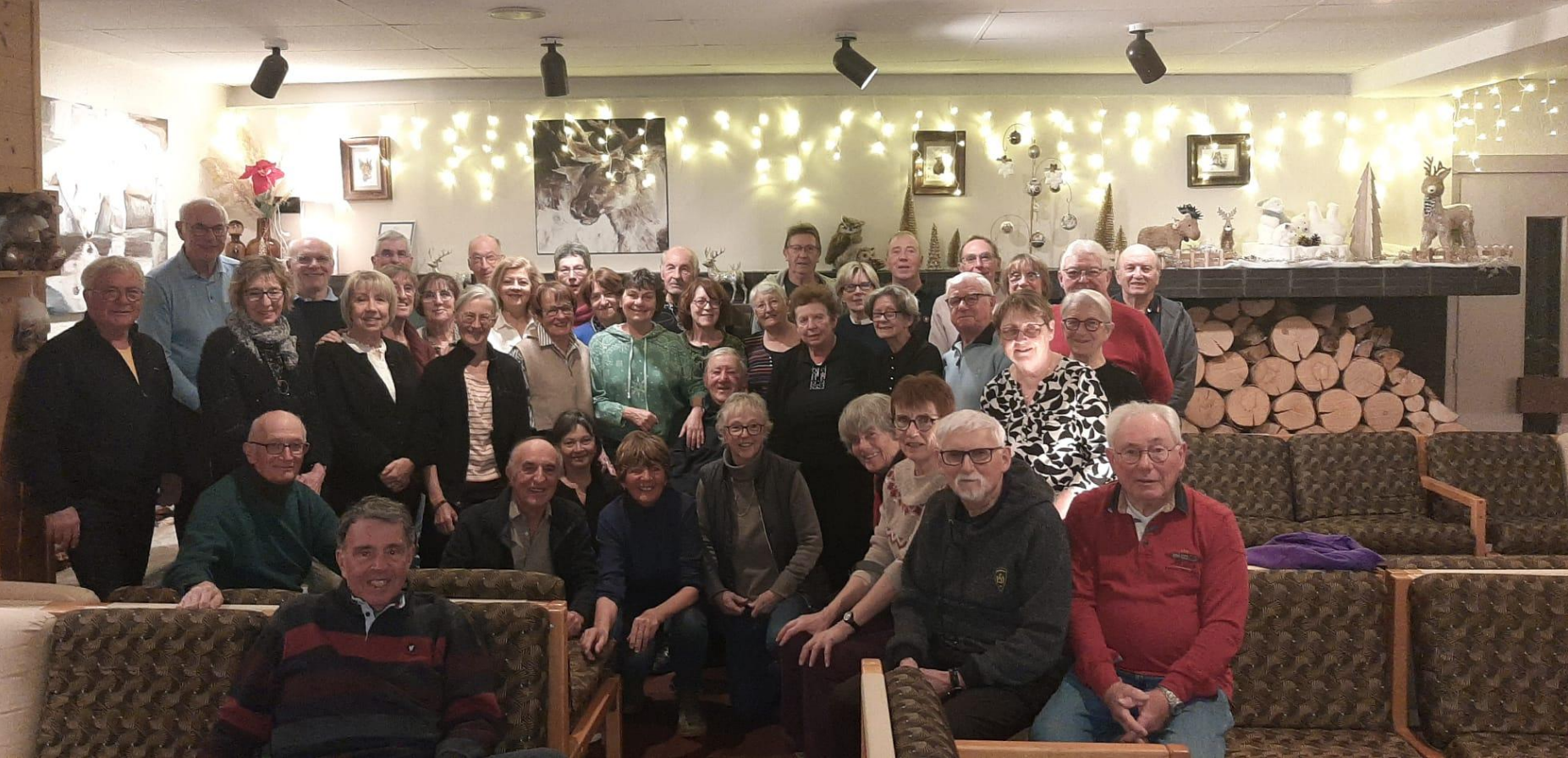
Le groupe des participants